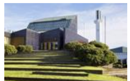
Alvar Aalto -keskus